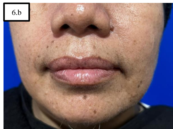
GAMBAR 6. FOTO PASIEN SEGERA SETELAH TINDAKAN CHEMICAL PEELING (A. PERIORBITAL DAN B. PERIORAL)

Pada follow up hari ke-8 paska tindakan menunjukkan peningkatan kelembapan kulit, penurunan TEWL serta perbaikan tekstur kulit dengan berkurangnya kedalaman kerutan pada daerah periorbital yang terlihat pada Gambar 7 dan daerah perioral pada Gambar 8.