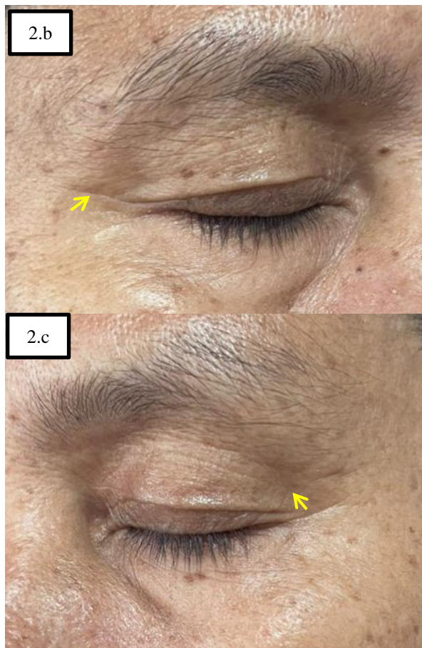
GAMBAR 2. TAMPAK FINE WRINKLE PADA DAERAH PERIORBITAL (A,B,C MATA KANAN DAN KIRI PANAH KUNING)