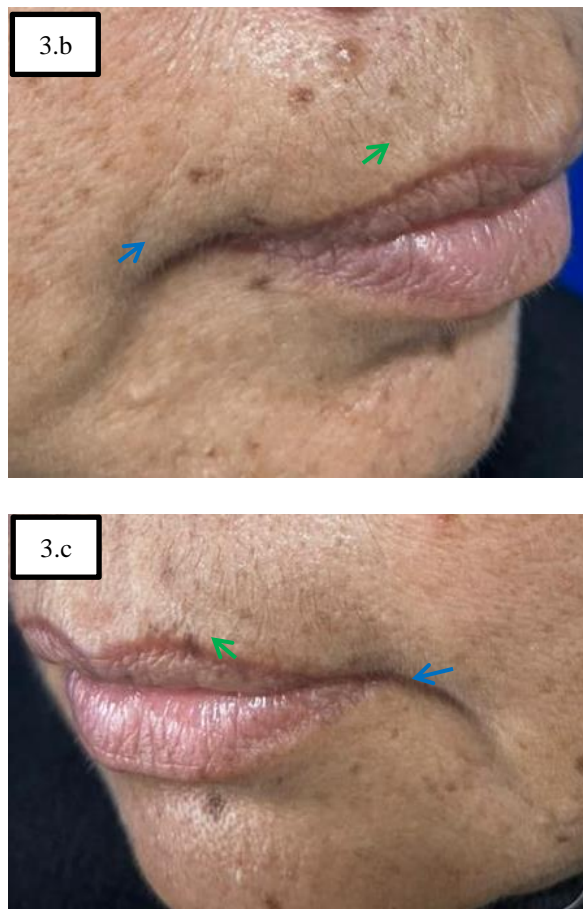
GAMBAR 3. TAMPAK FINE WRINKLE PADA UPPER LIP LINES (A,B,C PANAH HIJAU) DAN DEEP WRINKLE PADA CORNER OF MOUTH LINES (A,B,C PANAH BIRU)