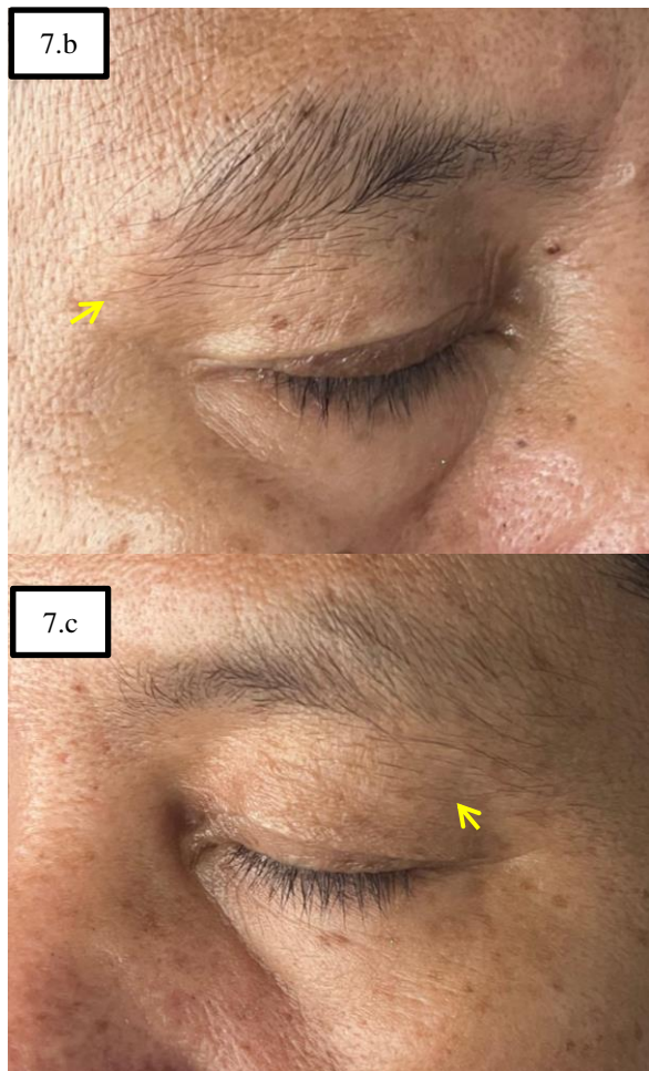
GAMBAR 7. FOTO FOLLOW UP WRINKLE HARI KE-8 PADA DAERAH PERIORBITAL DAN SUDUT MATA BERKURANG (A.B.C MATA KANAN DAN KIRI PANAH KUNING)

Pemeriksaan periorbital follow up setelah hari ke-8 didapatkan pemeriksaan TEWL: 22,50 g/m 2 /h, pemeriksaan SC: 7,60 a.u, pemeriksian Sebumeter: 4 µg/cm 2 dan pH: 5,09.