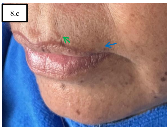
GAMBAR 8. FOTO FOLLOW UP WRINKLE HARI KE-8 PADA DAERAH PERIORAL MATA KANAN DAN KIRI (A.B.C BIBIR KANAN DAN KIRI PANAH HIJAU DAN BIRU)

Pemeriksaan perioral follow up setelah hari ke-8 tindakan didapatkan pemeriksaan TEWL: 54,04 g/m 2 /h, pemeriksaan SC: 31,26 a.u, pemeriksian Sebumeter: 12 µg/cm 2 dan pH: 5,70.